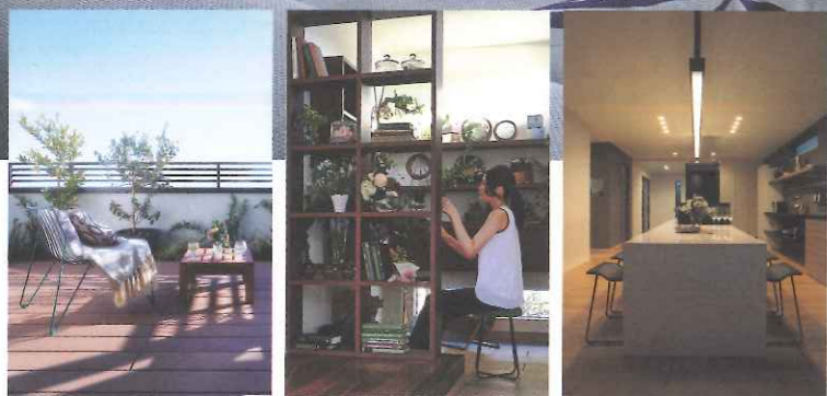
※見学会の建物と写真は異なります。