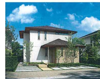
※実際の建物とは異なります。