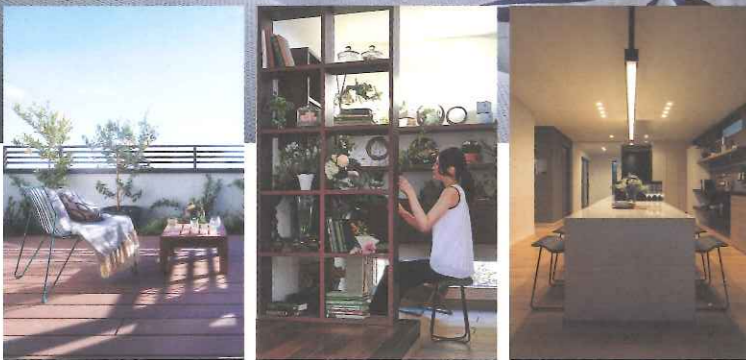
※見学会の建物と写真は異なります。